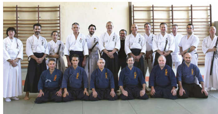
Stage à Montfavet (Vaucluse), samedi 15 et dimanche 16 janvier 2022.

Vous voulez apprendre à vous défendre à mains nues contre un adversaire ? Venez rejoindre l'école Aïki-jujutsu Maroteaux de Die.