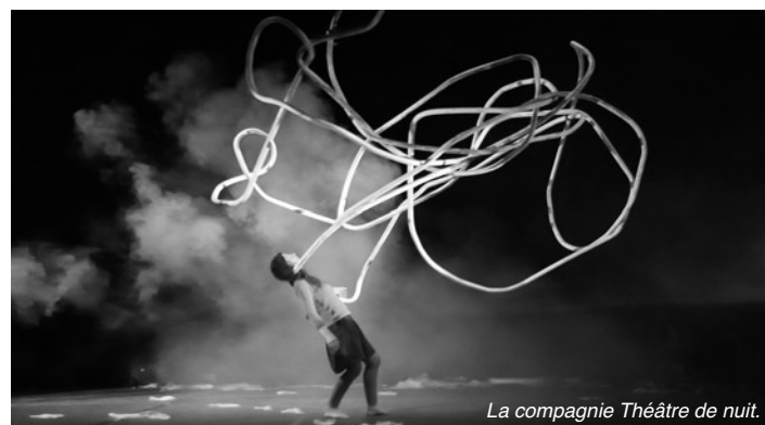
La compagnie Théâtre de nuit.

Le 9 février prochain démarrera la nouvelle saison du théâtre de Die-Les Aires. Une saison éclectique en continuité avec ce qui est proposé au théâtre : de la danse, du théâtre, du cirque, de la musique, de l'art de rue pour les plus jeunes, les adultes et en famille.