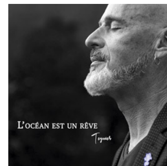
L'OCÉAN EST UN RÊVE Teyssier

À la rédaction du Journal du Diois on préfère «Éole» et «Nos lits qui brûlent».