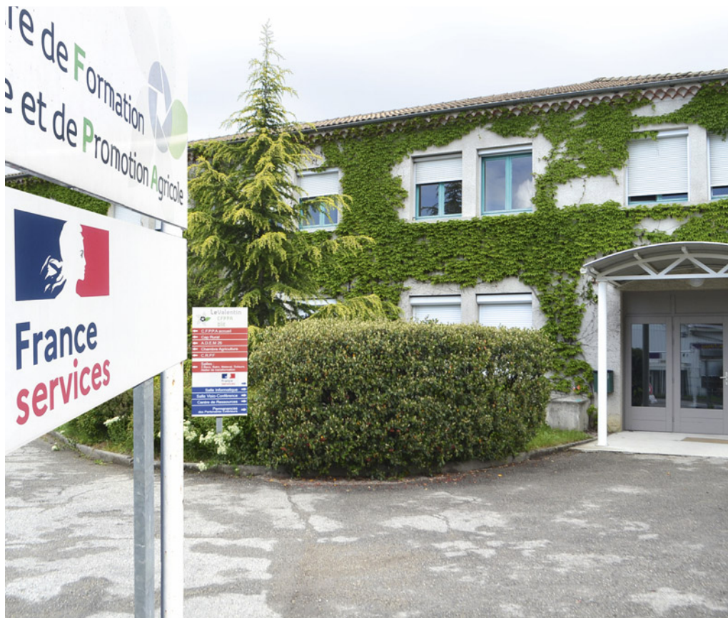
L'Espace France Services de Die est situé dans les locaux du CFPPA, avenue de la Clairette - Photomontage JDD.

Avec pas loin de 5 000 demandes par an, l'Espace France Services du Diois a la deuxième fréquentation la plus importante de toutes les structures de ce type en Drôme, après celle de Livron-Loriol. En effet, face à l'essor du tout numérique, l'Espace France Services est souvent devenu «le dernier recours» pour des habitants éloignés des outils informatiques et qui recherchent encore de l'humain pour régler leurs démarches administratives. Face aux missions nouvelles et aux demandes croissantes, à la particularité de missions souvent complexes, le modèle devra sans doute évoluer. D'autant plus que celui-ci reste fragile (pérennité des financements et des postes, portage du label, accompagnement des compétences).